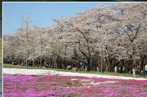
みやぎ千本桜の森 (約7km地点)