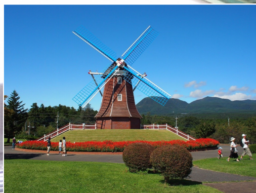
大胡ぐりーんふらわー牧場 (約13km地点)