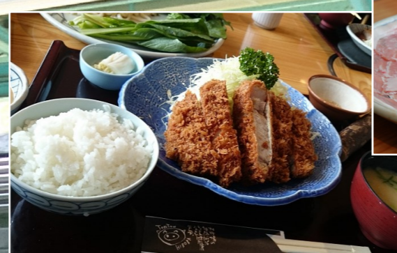
ミートパラダイス とんかつ広場 (約8km地点)