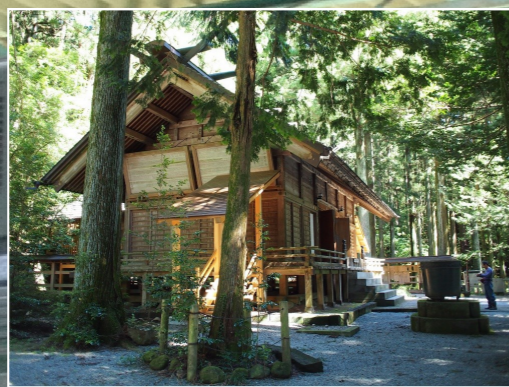
三夜沢赤城神社 (約8km地点から北へ2km)