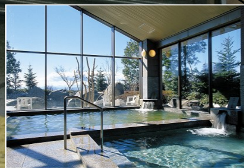
粕川温泉 元気ランド (約2km地点)