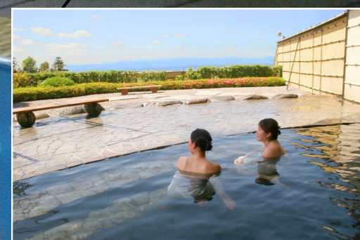
富士見温泉・道の駅ふじみ (約17km地点)